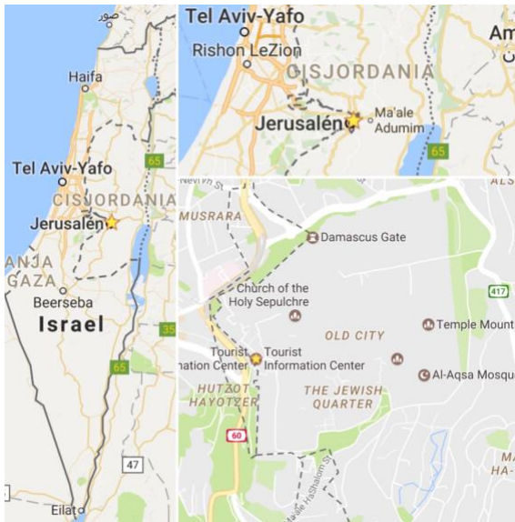
Imagen 3: Bug del territorio palestino (Rodríguez, 2016) 10

La ocupación de Israel en territorio palestino demuestra un caso más de zonas de convivencia fronteriza en limbo administrativo, no solo al interior de un Estado que dividió dos naciones, y que ha servido para aislar a la comunidad árabe-musulmana, sino también de cara a sus vecinos, Egipto y Jordania, para impedir la entrada irregular de refugiados y migrantes africanos.