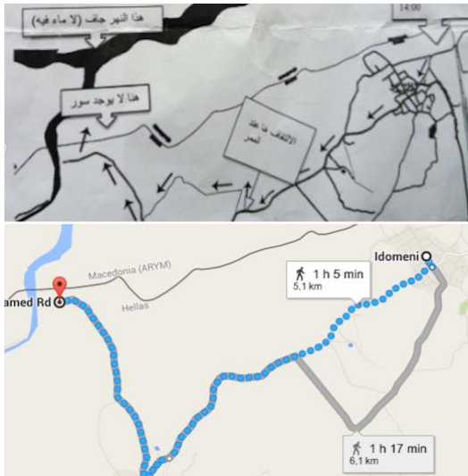
Imagen 2: Instrucciones para salir de Idomeni (2016).

En el papel se especificaba que a cinco kilómetros se podía cruzar la frontera porque no había vallas metálicas, pero había río, un río que supuestamente estaba seco, según se indicaba en las instrucciones del papel, aunque la imagen de Google Maps mostraba lo contrario (véase “Imagen 2: Instrucciones para salir de Idomeni”).